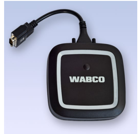
WABCO Diagnostic Interface 3