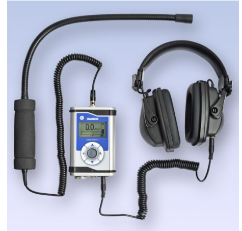
WABCO Ultrasonic Leakage Finder 2.0